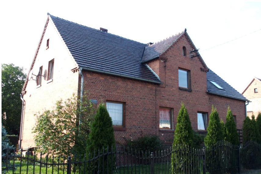
Widok budynku od południowego - wschodu

8. Fotografia z opisem wskazującym orientację albo mapa z zaznaczonym stanowiskiem archeologicznym